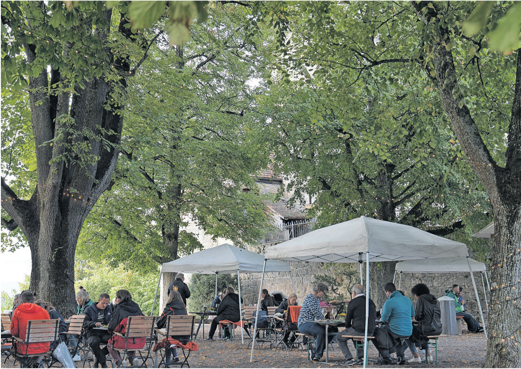
Im idyllischen Rahmen genossen zahlreiche Gäste Bio-Spezialitäten aus der Region.

MURTEN | Etwa 500 Personen meldeten sich für die Premiere des Bio-Genuss-Rundgangs vom letzten Freitag- und Samstagabend im Städtchen Murten an. Murten Tourismus/ Fribourg Region lancierte das neue Tourismus-Projekt, welches bei den Besucherinnen und Besuchern grossen Anklang fand. Gemüsebetriebe, Weinkellereien, Restaurants und eine Coniserie von Murten und der Region arbeiteten für dieses Projekt erstmals zusammen. An acht Ständen wurden kulinarische Spezialitäten, Weine des Mont Vully und ein Dessert serviert. Vorgesehen ist, dass der Bio-Genuss-Rundgang auch im nächsten Jahr stattfinden wird.